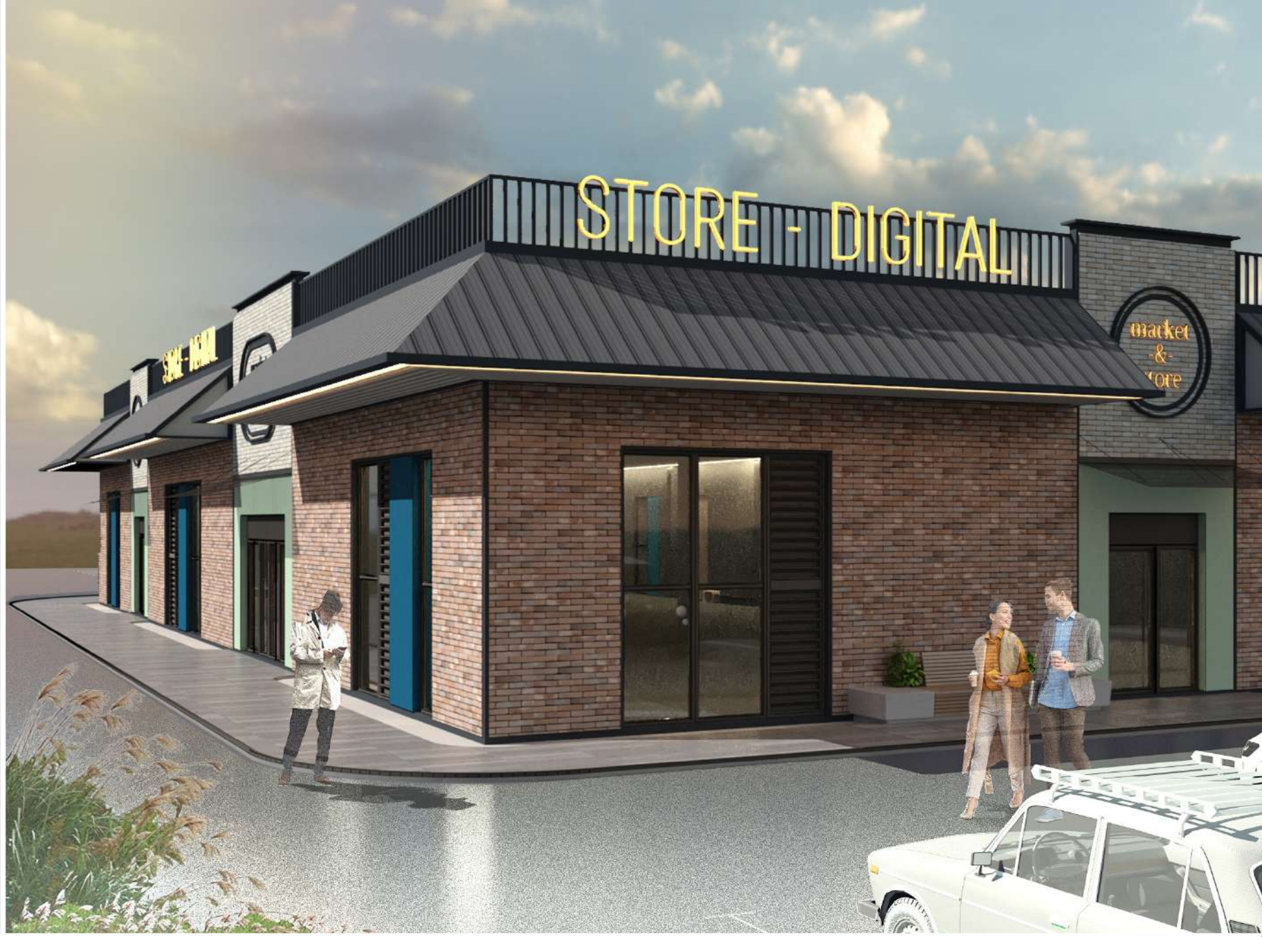
ТОРГОВЫЙ ОБЪЕКТ в микрорайоне Север в г. Борисов